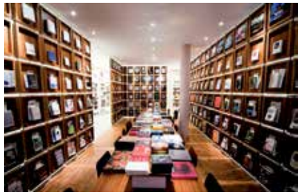
Literatur & Kaffee. Das gefällt.