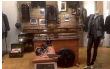
Pyrate Style – unverwüstlich & cool

re Produkt während meines Gangs durch den Laden entdecken. Jedes einzelne Teil ist originell und liebevoll designt und verpackt. Wenn einem am Anfang die Idee fehlt, die Auswahl dann aber so gut und vielseitig ist, dass man sich am Ende gar nicht entscheiden kann – dann ist das der perfekte Laden.