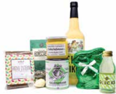
Geschenkeset „Ostererwachen“, ca. 50 € Mutterland City, Poststraße

Was der Osterhase Ihnen wohl dieses Jahr ins Osternest legt? Vielleicht eines dieser schönen Geschenke aus der Hamburger Innenstadt?!