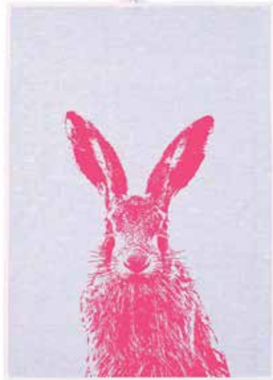
Frohstoff Geschirrtuch „Hase“ , neonpink, 50 x 70 cm, ca. 15 € Oschätzchen, Hohe Bleichen