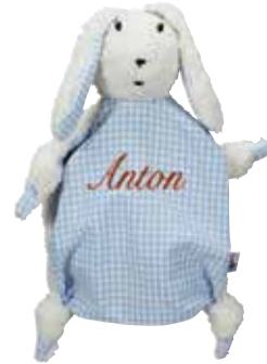
Personalisierbares Schnuffeltuch „Hase“, 100% Bio-Baumwolle, ca. 24 € Hansekind im Levantehaus, Mönckebergstraße