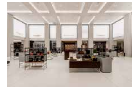
Die neue Luxury Hall im Alsterhaus