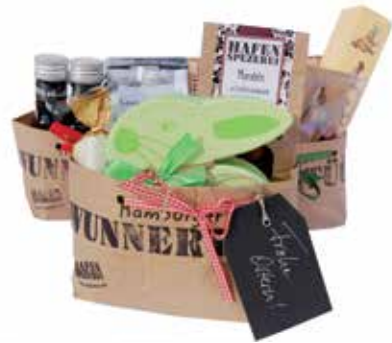
Hamburger Wunnertüt. Oster-Geschenketüte, ca. 26 € Hafen-Spezerei, Überseeboulevard