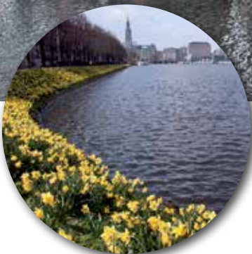
Blumenpracht an der Binnenalster – der Ballindamm blüht

Frühlingsgefühle kommen auf, wenn leckeres Essen und kühle Getränke in den schönsten Außenbereichen der Innenstadt serviert werden. Wir stellen Ihnen einige Restaurants, Cafés und Bars vor, die zum Verweilen einladen.