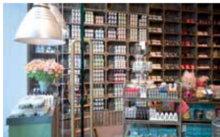
Mutterland: ganz viele Geschenkideen

Buchläden liebe ich sowieso. Und „Stories!“ im Hanseviertel ist ganz besonders toll. Ich lese nicht gern am Tablet, sondern gehöre noch zu den Menschen, die echte Bücher lesen, die ein Buch in der Hand halten und umblättern wollen. Mein Mann versteht mich da nicht so richtig – er fragt sich, warum man lieber 15 Bücher als ein Tablet mit in den Urlaub nimmt. Bei „Stories!“ sieht man nicht nur den Rücken der Bücher. Die meisten sieht man von vorne, so dass man sich sofort ein gutes Bild vom Werk machen kann. Daneben ist die gesamte Einrichtung und Gestaltung des Ladens außerordentlich ansprechend. Man hat das Gefühl, dass an diesem Ort Literatur noch wirklich ernst genommen wird. Außerdem kann man im Geschäft einen Kaffee trinken – das gefällt mir auch.