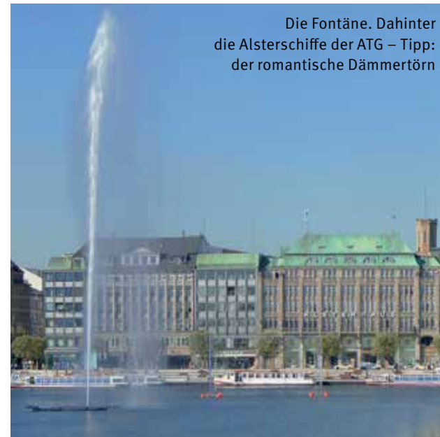
Die Fontäne. Dahinter die Alsterschiffe der ATG – Tipp: der romantische Dämmerföhn