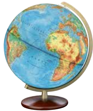
Columbus Duplex Leuchtglobus , 30 cm Durchmesser, Holzfuß Nußbaum gebeizt, Meridian Messingfarben, beidseitig gradiert, ca. 100 € Dr. Götze Land & Karte, Alstertor