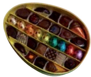
Osterbox mit Pralinen und Schokoladeneiern , ca. 38 € Neuhaus Pralinen, Neuer Wall